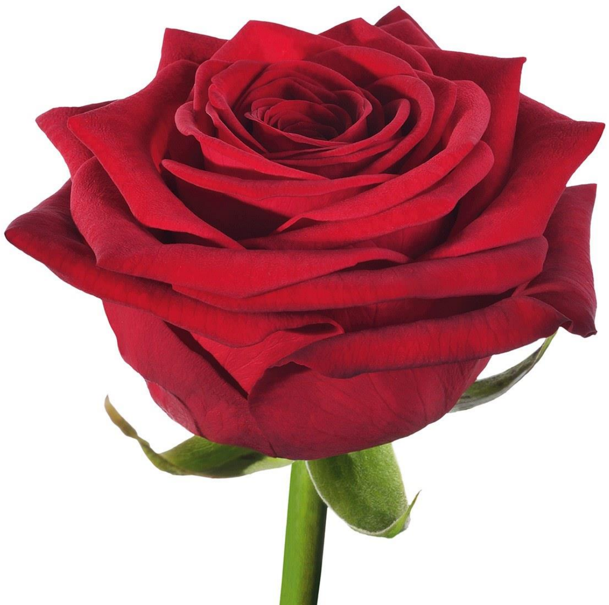
Bild vun enger Rous fir an d'Mëtt vum Dësch ze leeën. Falls ee keng Rousen am Gaart huet.